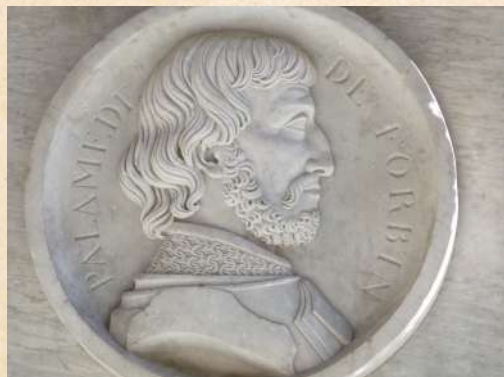
Palamède de Forbin, ©Malost

Les premières traces écrites du château de La Barben remontent à 1064 : on trouve en effet, dans le cartulaire des moines de l'Abbaye Saint-Victor de Marseille, une mention du Castrum de Berbenti . On ignore quand le château devint propriété de la famille Pontevès : la généalogie de cette famille est, elle aussi, relativement mystérieuse avant le XIII e siècle.