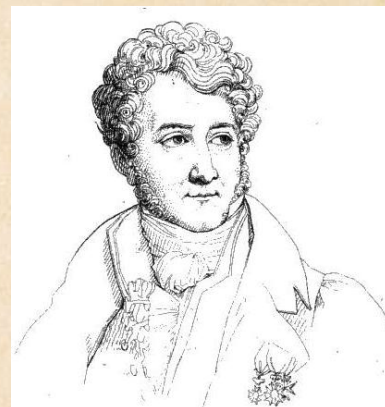
Auguste de Forbin, gravure de J.M.N. Frémy, d'après Pauline Guérin

En 1909, un important tremblement de terre touche le château. Une de ses tours s'effondre et des travaux de restauration sont rapidement entrepris pour rebâtir la tour. Le château et les jardins à la française ont été classés au titre des Monuments historiques en 1984. En décembre 2019, le château est racheté par Vianney d'Alañon pour y créer le parc Rocher Mistral.